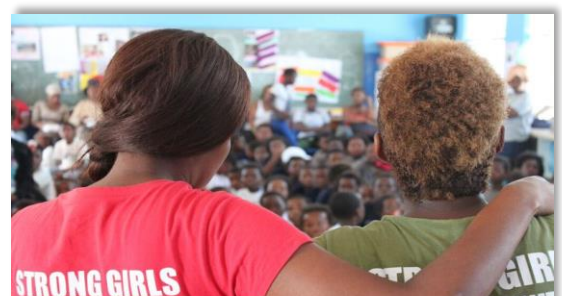
Starke Organisationen für starke Frauen* und eine starke Gesellschaft, © Camp Group gGmbH

Werdet Teil von Boxgirls International. Erfahrt mehr unter www.girlsinthelead.org